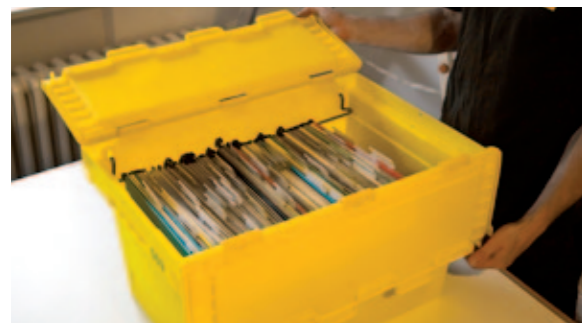
↑ AKTEN UND HÄNGEREGISTER

der Deutschen Bahn AG sind seit 2003 bereits mit der DMS umgezogen. Und es werden täglich mehr.