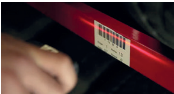
↑ ERFASSUNG IN DATENBANK