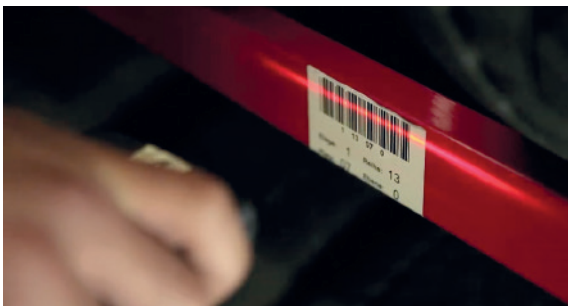
^ ERFASSUNG IN DATENBANK