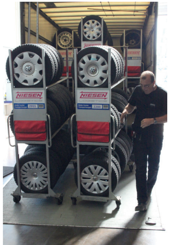
^ NUTZUNG RÄDERWAGEN